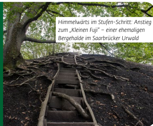
Himmelwärts im Stufen-Schritt: Anstieg zum „Kleinen Fuji“ – einer ehemaligen Bergehalde im Saarbrücker Urwald

Der Wald ist ein faszinierendes Öko-System und zugleich ein dichtes Netzwerk, in dem verschiedene Organismen miteinander kommunizieren. So nehmen Bäume über die Wurzeln Verbindung zu ihren Nachbarn auf. Dabei nutzen sie das Pilzgeflecht, das den ganzen Waldboden durchwebt. Wie über Glasfaserkabel tauschen die Wurzeln elektrische Signale aus. Wissenschaftler sprechen vom Wood-Wide-Web – vom waldweiten Netz. Erforscht ist das bislang nur ansatzweise.