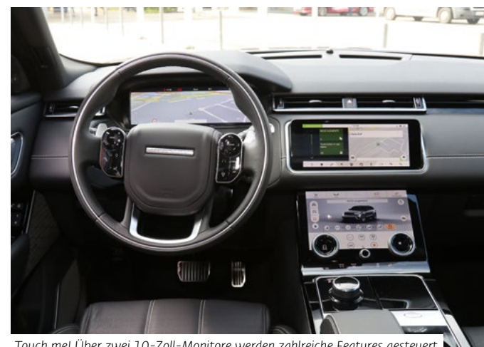
Touch me! Über zwei 10-Zoll-Monitore werden zahlreiche Features gesteuert