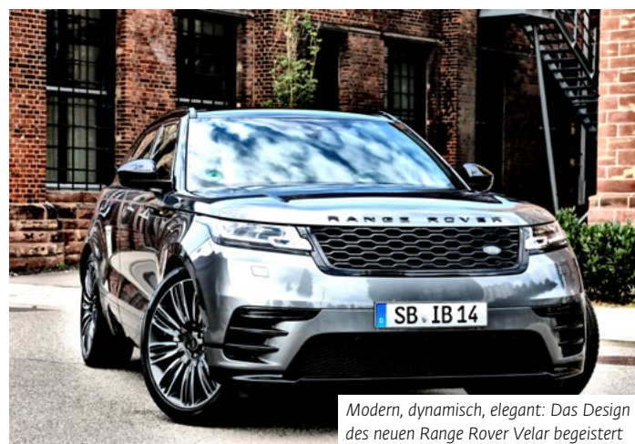
Modern, dynamisch, elegant: Das Design des neuen Range Rover Velar begeistert