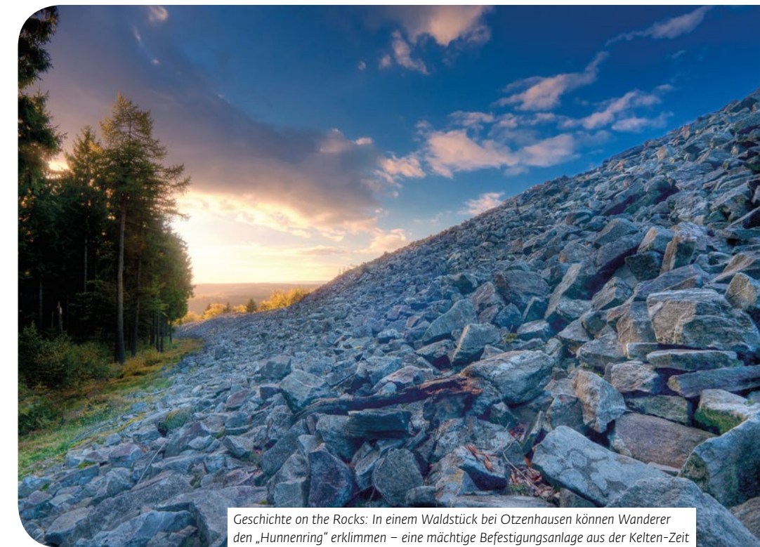
Geschichte on the Rocks: In einem Waldstück bei Otzenhausen können Wanderer den „Hunnenring“ erklimmen – eine mächtige Befestigungsanlage aus der Kelten-Zeit

Einst war ganz Mitteleuropa von dichten Urwäldern bedeckt. Doch diese Zeiten sind vorbei, nur wenige grüne Inseln haben überdauert. Immerhin: Noch heute gehört Deutschland zu den walddreichsten Ländern Europas. Über 90 Milliarden Bäume wachsen hierzulande. Noch immer ist der Wald der Lebensraum einer Vielzahl von Tier- und Pflanzenarten, für Pilze und Flechten, die Bühne für die großen und kleinen Dramen der Natur. Und so erleben wir den Wald mit allen Sinnen. Hören das Rauschen der Blätter. Lauschen dem Zwitschern der Vögel. Spüren die erfri-