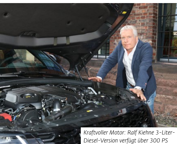
Kraftvoller Motor: Ralf Kiehne 3-Liter-Diesel-Version verfügt über 300 PS

Das Cockpit ist betont puristisch, ja geradezu futuristisch. Die Zahl der Schalter und Bedieneinheiten wurde auf ein Minimum beschränkt. Das neue Infotainment-System „Touch Pro Duo“ trumpft gleich mit zwei hochauflösenden 10-Zoll-Monitoren auf – für Unterhaltung und Kontrollanzeigen. Einer sitzt wie gewohnt oben im Armaturenbrett, der untere wurde im vorderen Bereich der Mittelkonsole integriert. Hier ragen nur noch die Drehregler für die Klimaautomatik und die Lautstärke heraus. Der runde Wählschalter für die Automatik fährt – wie bei allen