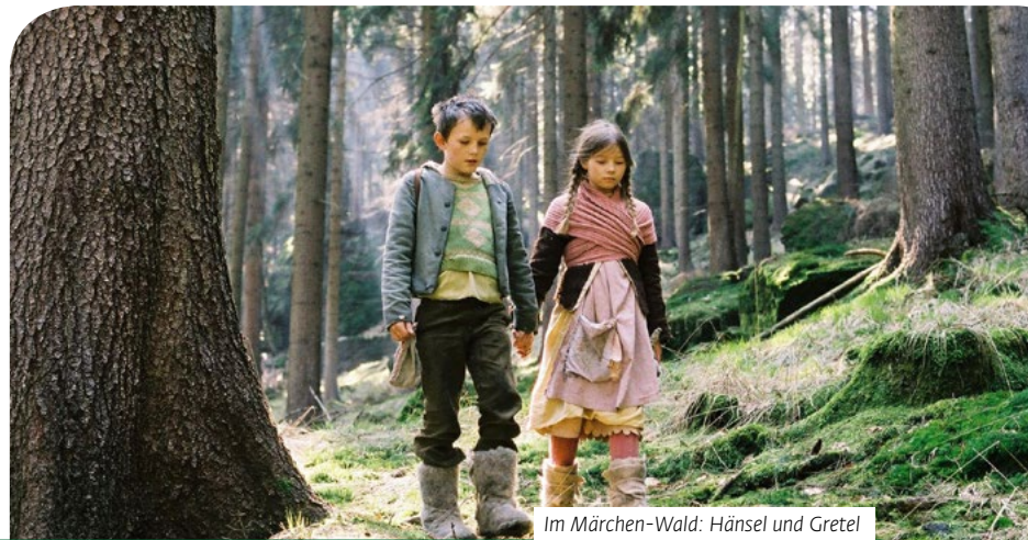
Im Märchen-Wald: Hänsel und Gretel

bild des Waldes. Umgefallene Bäume, ausgewaschene Wege, Baum-Moose, farbenprächtige Pilze, Blüten und bizarre Flechten überwuchern die Zeichen der Zivilisation. Verloren geglaubte Arten ursprünglicher Wälder und Auen kehren zurück, Bäume sterben ab, Wege wachsen zu.