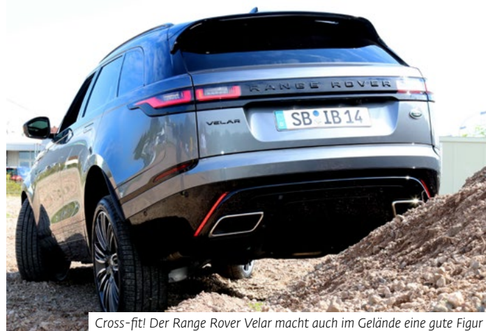
Cross-fit! Der Range Rover Velar macht auch im Gelände eine gute Figur