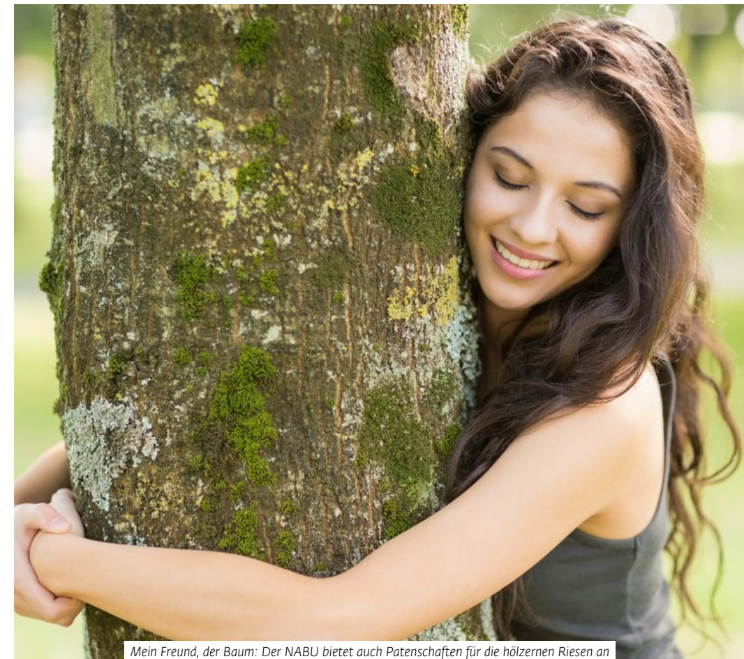
Mein Freund, der Baum: Der NABU bietet auch Patenschaften für die hölzernen Riesen an