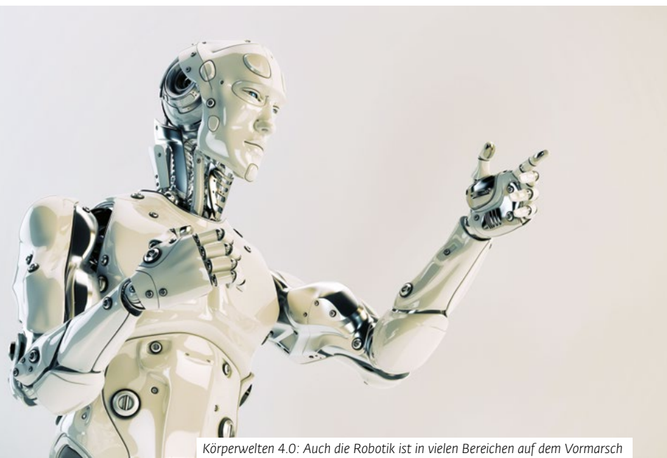
Körperwelten 4.0: Auch die Robotik ist in vielen Bereichen auf dem Vormarsch

Untertürkheimer Str. 24 // 66117 Saarbrücken Tel. +49 681 9294-0 // E-Mail: info@add.de // Internet: www.add.de