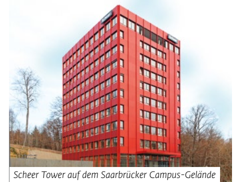
Scheer Tower auf dem Saarbrücker Campus-Gelände