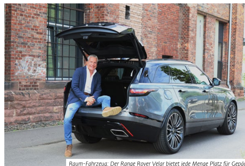
Raum-Fahrzeug: Der Range Rover Velar bietet jede Menge Platz für Gepäck

Automatik-Modellen der Marke – erst nach dem Aktivieren der Zündung empor.