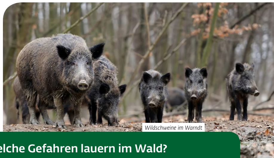
Wildschweine im Warndt

Es muss übrigens nicht immer der Schwarzwald sein. Selbst ein Spaziergang durch den Stadtpark hat einen positiven Effekt. So leiden Menschen, die maximal einen Kilometer von einer Grünanlage entfernt wohnen, seltener unter Depressionen und Herz-Kreislauf-Erkrankungen. Schon der Anblick der Farbe Grün senkt den Stress-Pegel, lindert Kopfschmerzen und erhöht die Denkfähigkeit. ■