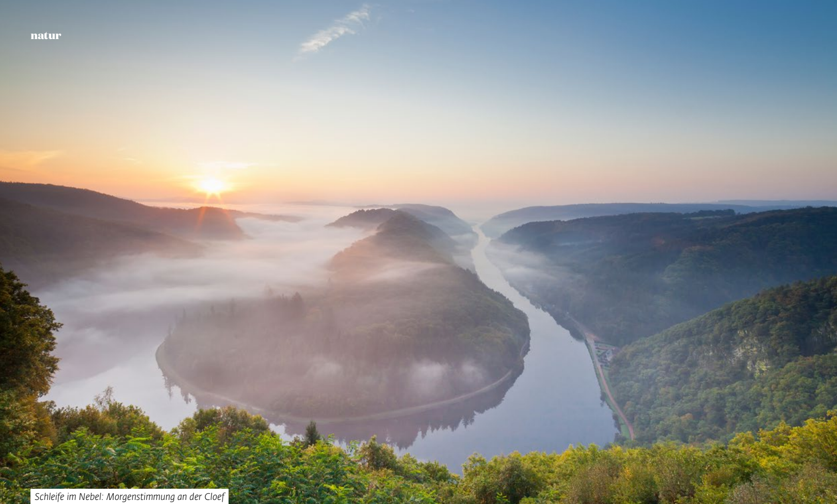
Schleife im Nebel: Morgenstimmung an der Cloef

wir im Wald in Berührung kommen. Der reine Sauerstoff, den wir im Grünen einatmen dürfen, tut sein Übriges. Je reiner der Sauerstoff, desto intensiver das Glücksgefühl.