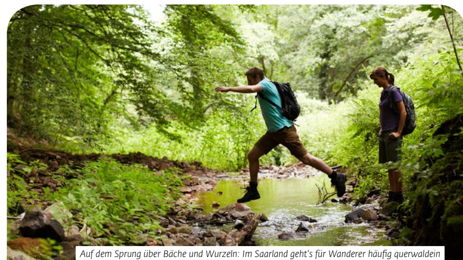
Auf dem Sprung über Bäche und Wurzeln: Im Saarland geht's für Wanderer häufig querwaldein

Vorsicht ist auch bei Zecken geboten. Im Sommer haben die bissigen Biester Hochsaison. Das Gesundheitsministerium rät daher allen Saarländern, sich gegen Hirnhautentzündungen impfen zu lassen, wenn sie sich beruflich oder privat häufig in Risiko-Regionen, wie z.B. in den Wäldern des Saarpfalz-Kreises, aufhalten. Ratsam sind auch lange Hosen und helle Kleidung.